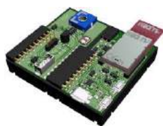
Sensor kit temperature, light intensity and voltage