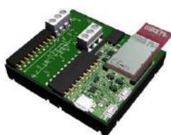
Relay kit switch connected device ON/OFF